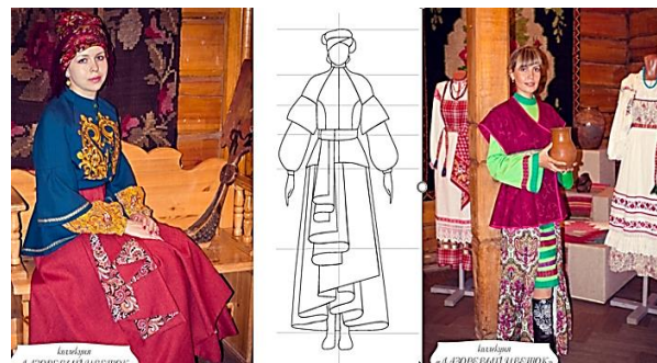
а) б) в) Рис. 5

украшенный декоративным текстилем и вышивкой, распашной юбки и юбки – "солнце". В модели использовалась вышивка двух видов: лентами и нитями.