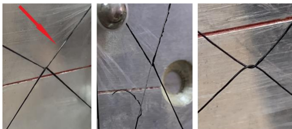
а) б) в) Рис. 2

При тех же начальных условиях электропроводящая композитная мононить выдержала 2000 циклов практически без внешних признаков деформации и разрушения поверхности. На рис. 2, в показан внешний вид композитной мононити после 2000 циклов истирания. В дальнейшей работе планируется провести более длительные циклы истирания до полного разрушения композитных мононитей.